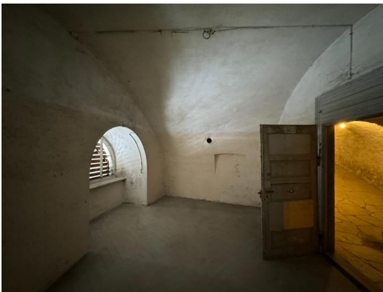
Raum mit Holzverschlag © Thilo Endres